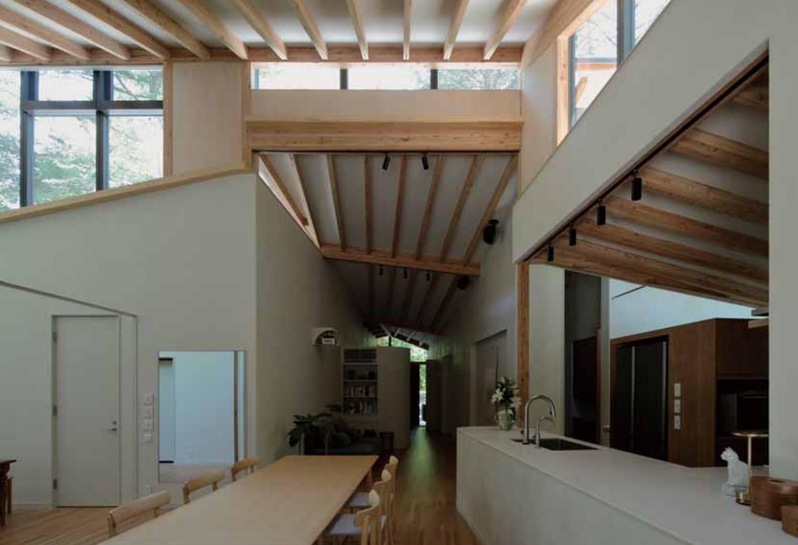
ダイニングから玄関方向を見る。屋根の3次元曲面と連動して、少しずつ高さの変わる登り梁が動きのある室内をつくる。

一様ではなくそれぞれの屋根面で違ってくる。また屋根やハイサイドライトのガラスに周囲の樹木の影が映り込み、様々なかたちで建物と自然が呼応している。細やかなデザインや素材の選定により周辺環境との調和が図られている。