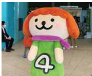
ミヤギテレビのゆるキャラ「だよん」がお出迎え