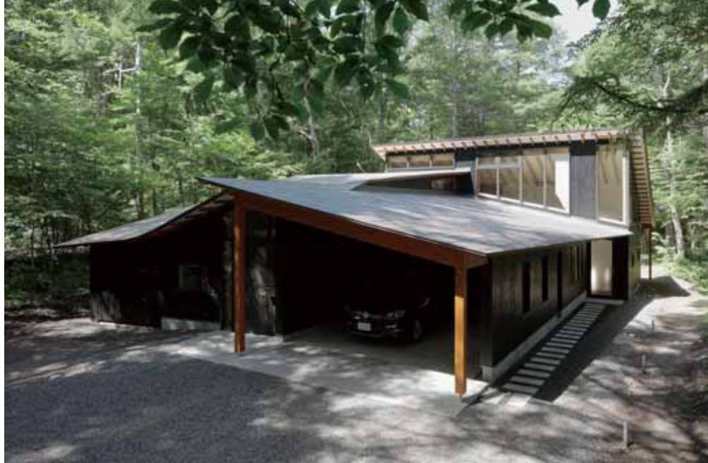
北東側外観。右側が車庫、左側が玄関アプローチ。

のデザインがうまれた。大きさの異なる4枚の屋根は四方に流れる片流れとなっており、それを風車状に噛み合わせている。さらに屋根と屋根の間にズレをつかった。軒先は低くした。窪地に落ち葉がすっぽりと溜まったような、そんな印象を与える4枚の屋根は、木々に覆われた景観に馴染んでいる。