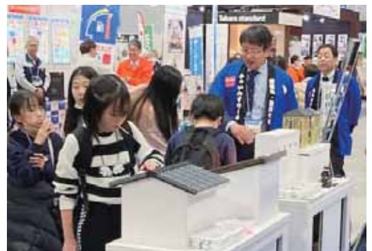
体感型展示模型・ミニチュア模型は子どもたちに大人気

全国ファインスチール流通協議会は、一般社団法人日本鉄鋼連盟建材薄板技術・普及委員会の協賛のもと2024年1月、ファインスチール普及活動の一環として、宮城・仙台 住宅リフォームフェアに出展。昨年、全面リニューアルした展示パネルと、2種類の体感型展示模型と屋根のミニチュア模型を従来どおり展示。お子さま向けのイベントも開催し、来場者にファインスチールをよりよく理解してもらえる展示会となりました。