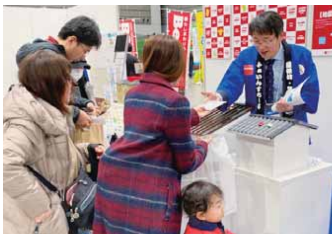
「瓦の形の製品もあるんだ」興味を持ってくれたお母さんにノベルティをプレゼント