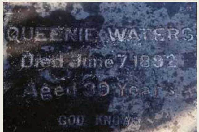
図2 アーネスト夫妻の墓(上)とクイニーの墓石に刻まれた文字(下)デンバーのフェアマウント墓地にアーネスト夫妻とトーマスが眠る。写真手前の、地面に敷かれた石がクイニーの墓石で、「QUEENIE WATERS」「Died June 7 1892.」「Aged 39 Years.」「GOD KNOWS」と刻まれている。