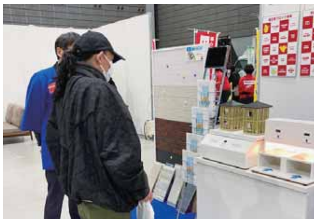
「スイッチ押してみたいけど…」耐震比較模型に興味深々