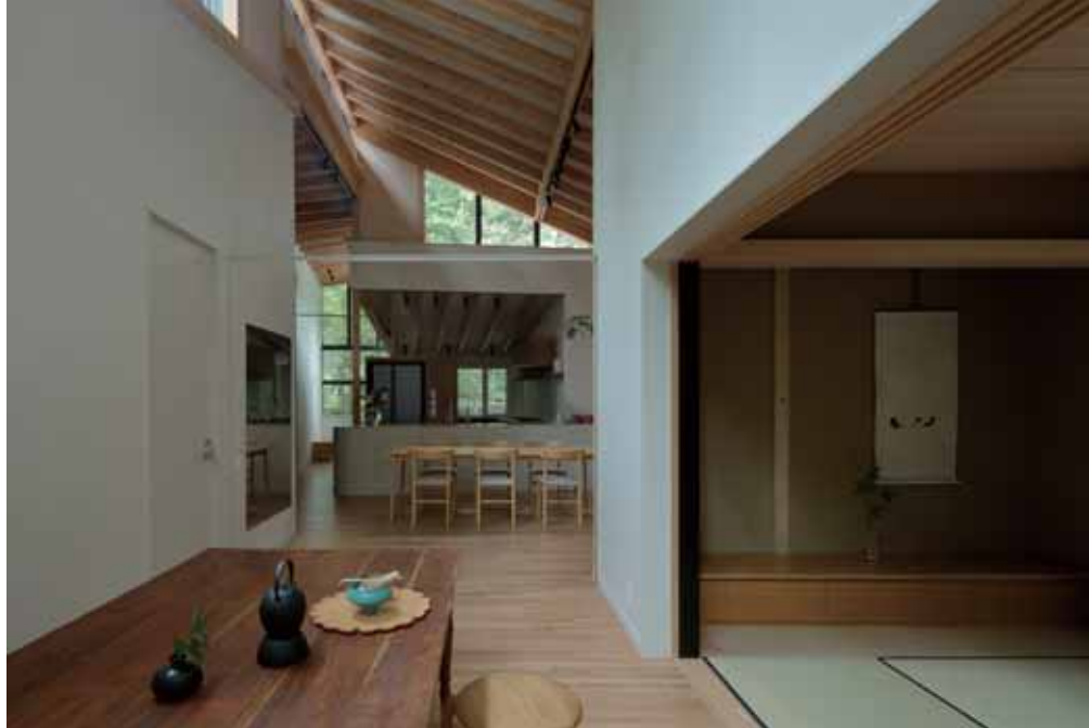
アトリエから右側に和室、正面にキッチンを見る。アトリエと和室は茶道の教室として間仕切ることができる。

『林の中の4枚屋根』を通して、周辺環境に馴染ませるということは、外からの視点で建築物を周辺環境に馴染ませるだけではなく、周辺環境を生活空間に採り込んで活用し、さらには建築素材や照明などが建築家により適材適所に加味されることで実現できる、ということを改めて認識できた。