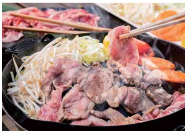
岩手県遠野式バケツジギスカン